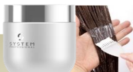
クリーム トリートメント