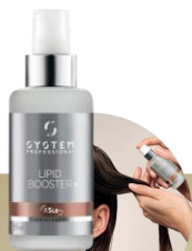
リピッド ブースタープラス