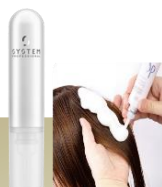
ホイップ トリートメント